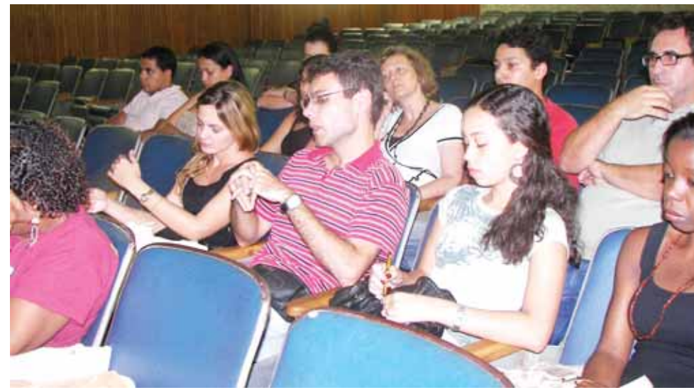
Funcionários de Volta Redonda em reunião articulada pelo Sintuff

que não pode, é fazê-lo com efeito retroativo e sem avisar, negociar e justificar previamente com todos os envolvidos. Isso gerou um impasse e na primeira reunião marcada para resolvê-lo, os ânimos se exaltaram, más palavras foram ditas por todas as partes e o diálogo ficou mais difícil. O importante é manter o foco na qualidade do serviço a ser prestado pela unidade. Todos sabemos que um excessivo rigor na aplicação das regras funcionais não dá certo. Há que ter uma certa flexibilidade. Por exemplo, pelas regras rígidas, só podem trabalhar dentro da secretaria os dois funcionários ali lotados. Um deles está de licença e o outro estava com férias marcadas para