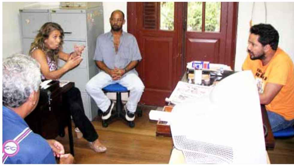
Sintuff vai até a Escola de Arquitetura averiguar denúncia de constrangimento