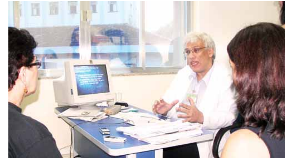
Reunião com diretor do setor de raio X para sanar problemas de assédio moral

O sindicato presente, a base organizada, a vitória será certa! Vamos a Luta!