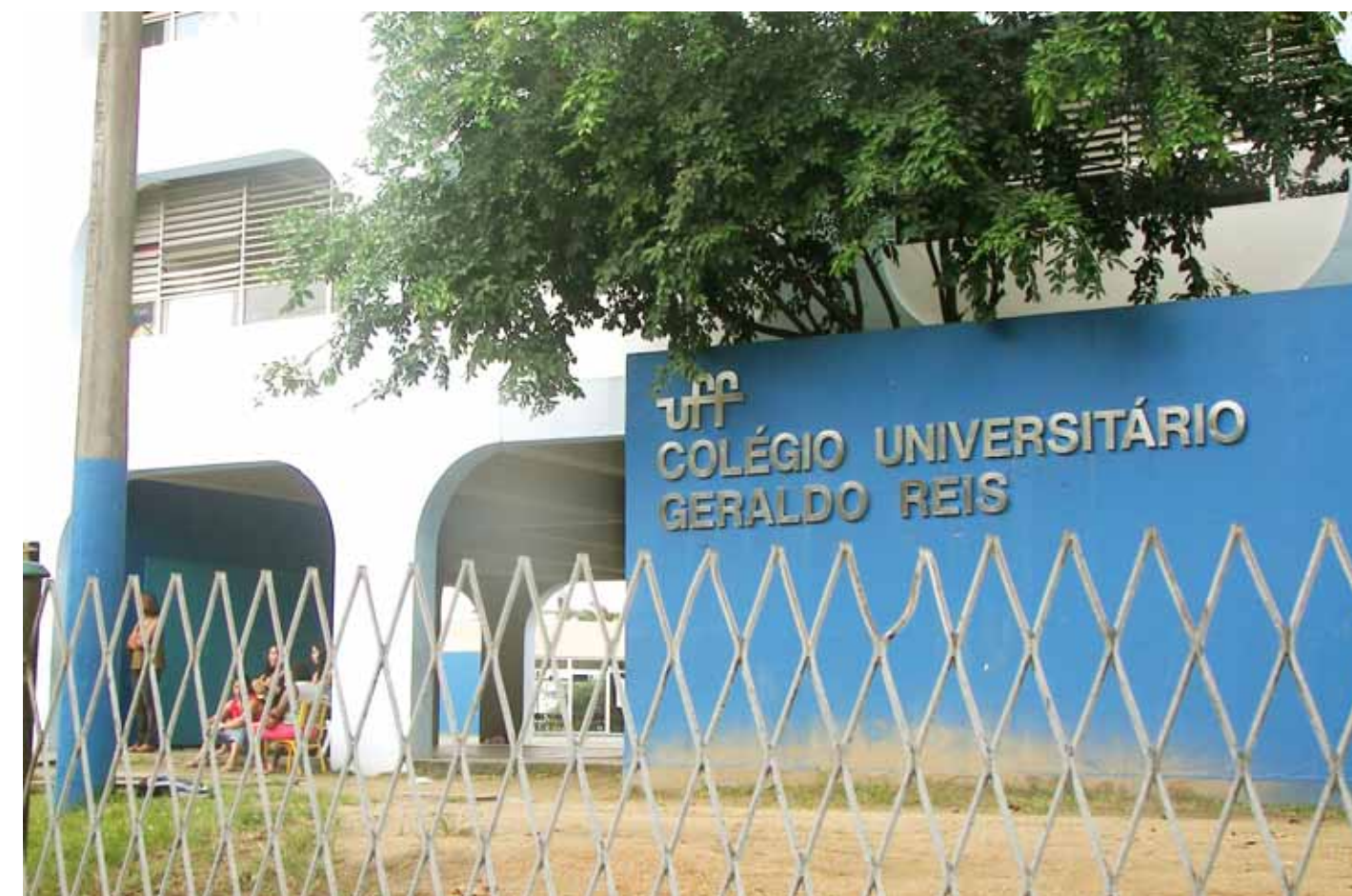
Colégio Universitário ainda carece de professores concursados. Maioria é cedida pelo estado ou substitutos.